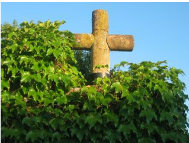
Croix de chemin

Quinze croix ont été repérées sur la commune de Chaponost, trois d'entre elles ont disparu, les autres, souvent d'origine ancienne, ont été remplacées au cours du premier tiers du XIX ème siècle.