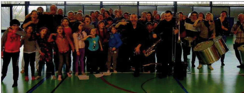
■ 50 habitants des deux communes formant le groupe des Gaulois, en répétition dans la salle omnisports de Chaponost.