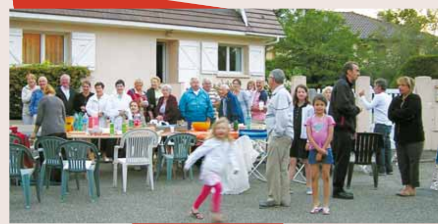
LA FÊTE DES VOISINS