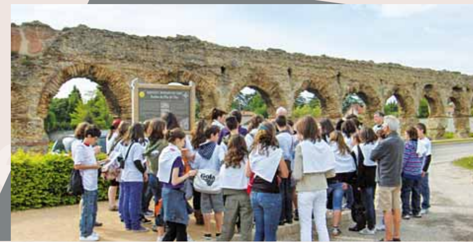
LES 40 COLLÉGIENS DE LESIGNANO en visite à Chaponost.