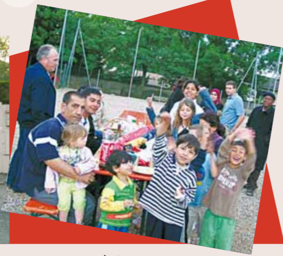
... JUSTE AVANT LA PLUIE (d'autres photos sur le site Internet de Chaponost )