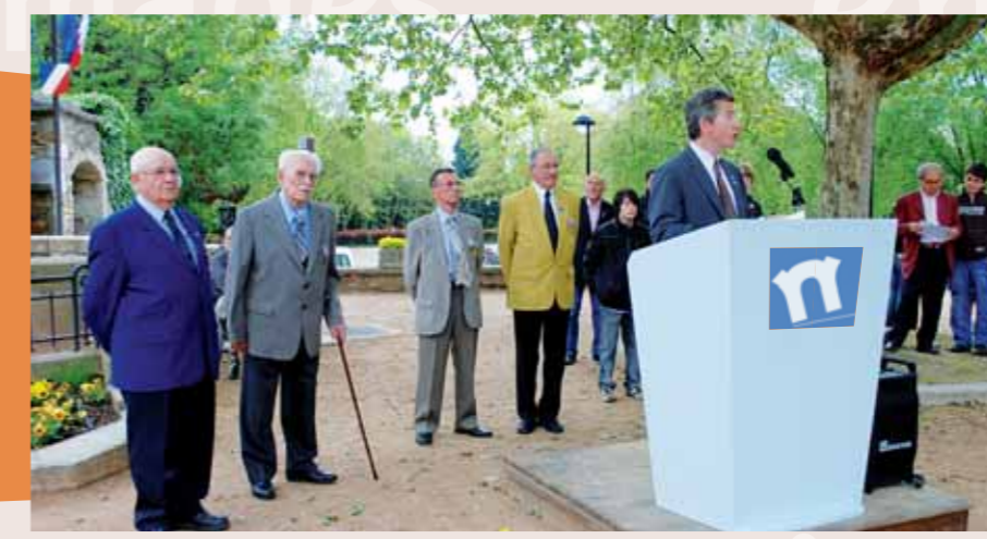
CÉRÉMONIE DU 8 MAI allocution de M. le Maire.