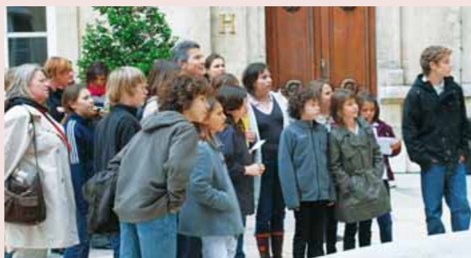
Ce fut un grand moment d'Histoire et de citoyenneté !

Les inscriptions se font au Centre social.