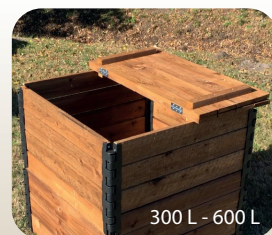
300 L - 600 L