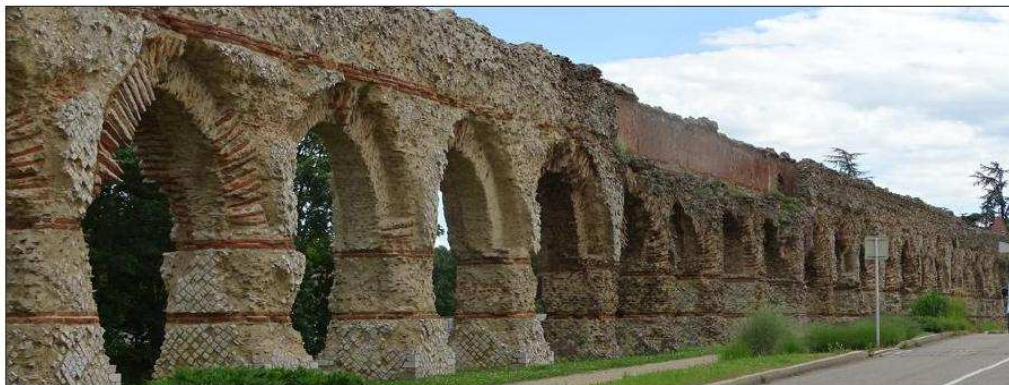
■ Treize nouvelles arches attendent votre générosité pour se refaire une beauté.

Il s'agira, comme précédemment, de consolider les structures existantes par l'apport de matériaux et la pose de mortiers de chaux, de restituer la base des piles et des arches afin de protéger les vestiges antiques de l'érosion, et de réaliser des patines afin d'atténuer les contrastes entre les parties anciennes et les parties restaurées.