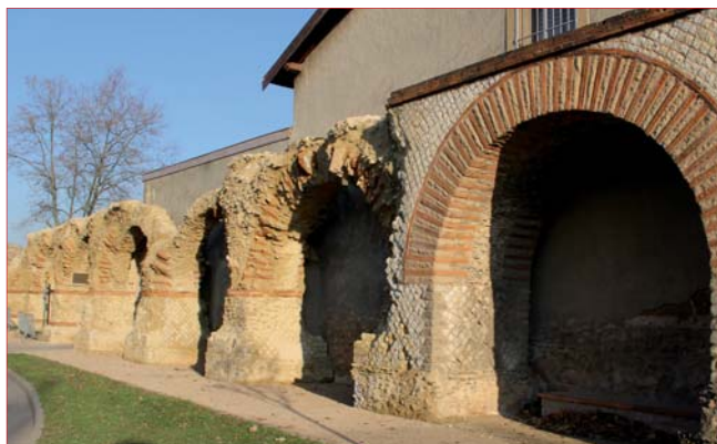
Enfilade d'arches rénovées.

Le nom de tous les donateurs (particuliers ou entreprises mécènes) sera inscrit sur une plaque de remerciements érigée près de l'aqueduc.