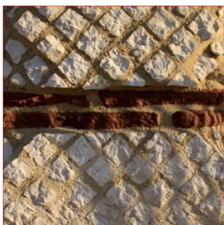
Parement réticulé. Restauration 2016.

La particularité de ce monument vient de son parement réticulé, parement de petites pierres à face carrée de 10 cm de côté, disposées en biais et évoquant les mailles d'un filet.