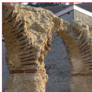
Reconstitution des arches. Restauration 2016.

Cet ensemble est exceptionnel en France, voire en Europe, de par l'importance du linéaire encore en élévation et la qualité architecturale de la construction.