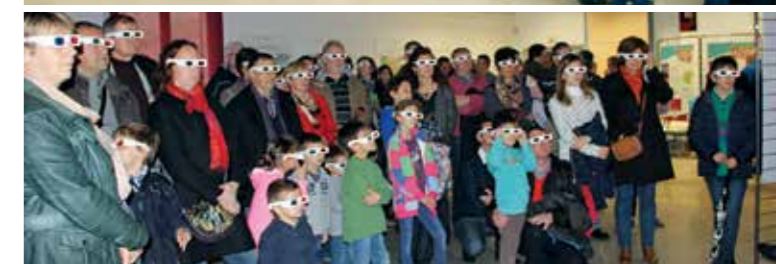
Diffusion de photos de Chaponost en 3D