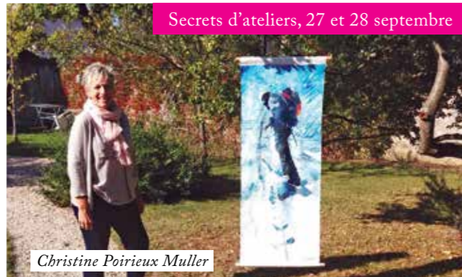
Secrets d'ateliers, 27 et 28 septembre