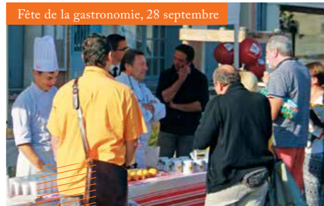
Fête de la gastronomie, 28 septembre

Plus de photos sur mairie-chaponost.fr retour en images