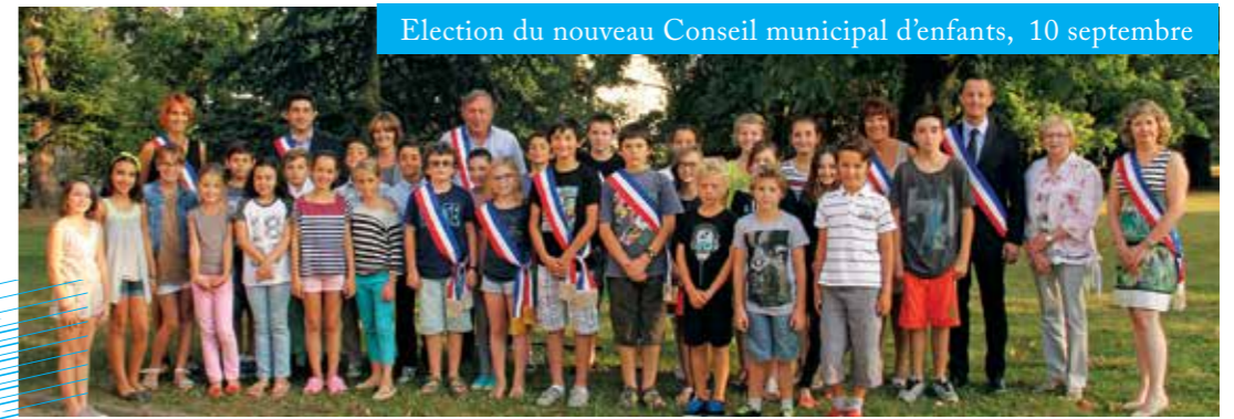
Election du nouveau Conseil municipal d'enfants, 10 septembre