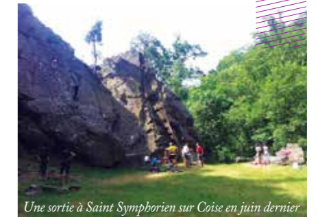
Une sortie à Saint Symphorien sur Coise en juin dernier

https://www.facebook.com/pages/Club-Escalade-Chaponost-Francheville ■