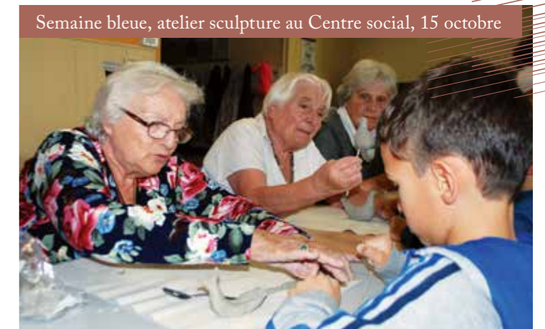
Semaine bleue, atelier sculpture au Centre social, 15 octobre