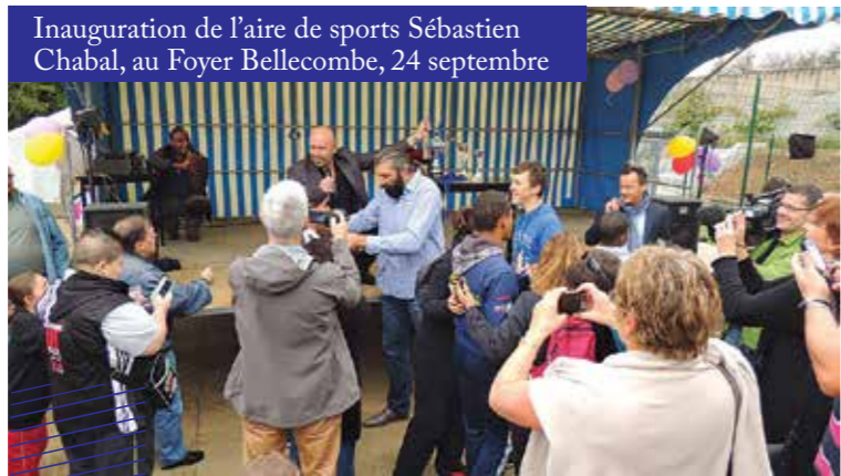
Inauguration de l'aire de sports Sébastien Chabal, au Foyer Bellecombe, 24 septembre